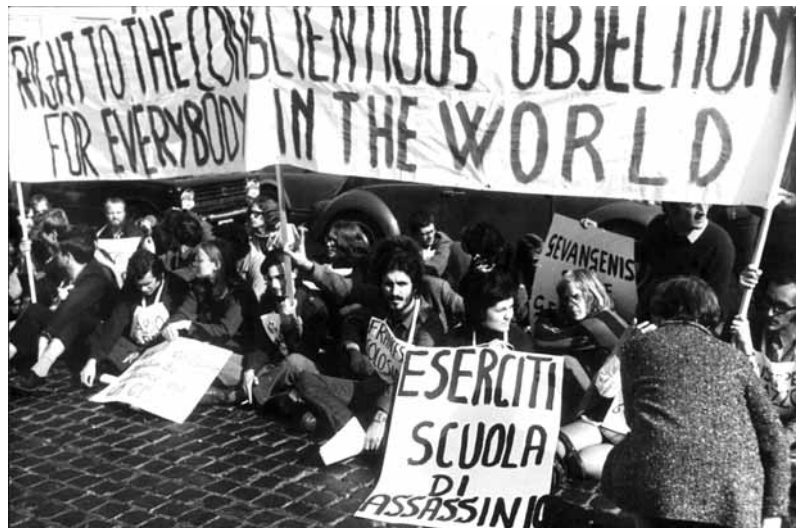
Protesta en favor d'objectors d'Itàlia, l'Estat espanyol i Portugal celebrada al Vaticà (Roma)

RR: El 15-M fins i tot ha replantejat la pròpia transició. Jo crec que nosaltres vam ser els indignats del 71.